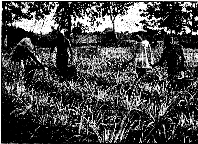
Der Recklinghäuser Verein „Avenir“ unterstützt die Ananas-Plantage in Togo mit Spendengeldern.